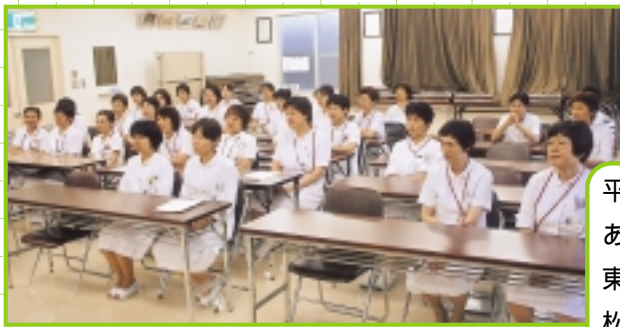
平成19年7月10日 あべ俊子衆議院議員来県 東予・中予の施設訪問 松山赤十字病院でミニ研修