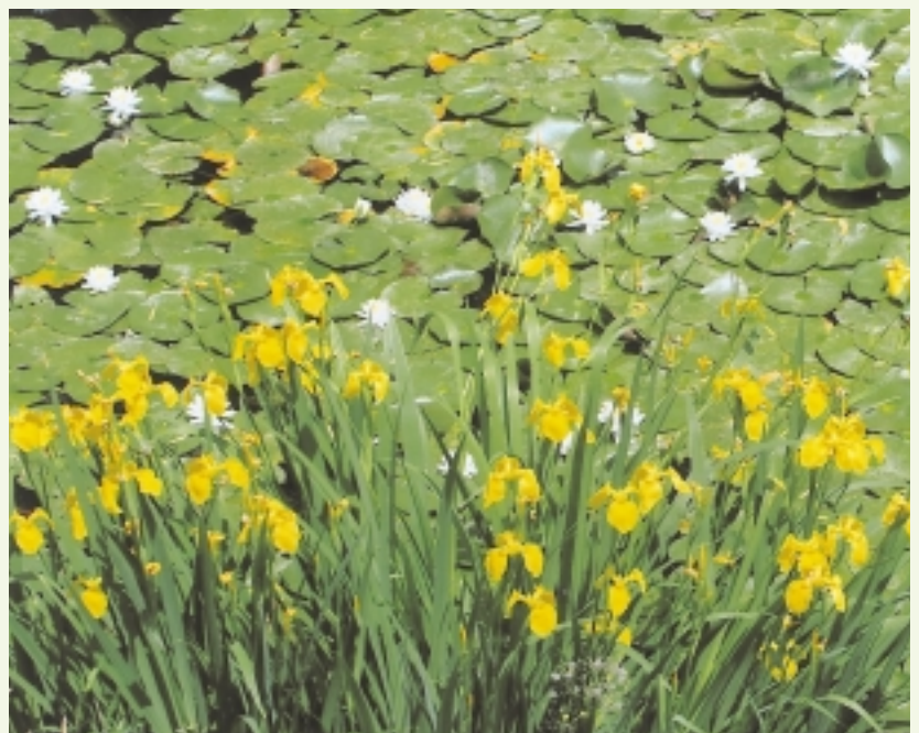
写真：道後公園のキハナショウブ

さて、愛媛県看護連盟通常総会を6月14日に予定しています。連盟総会には多くの会員にご出席いただき、今後の連盟活動等にご意見、ご支援をよろしくお願いします。